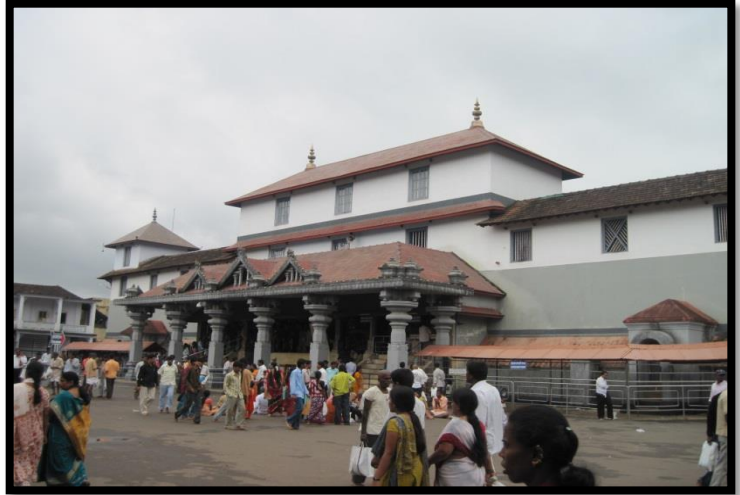
ధర్మస్థళ మంజునాథ దేవాలయం

తింటున్నారు సంతోషంగా. వారితో పాటే మేమూ సంతుష్టులుగా భుజించాం. వసతి గృహానికి చేరుకొని రెండు గంటలు విశ్రాంతి తీసుకొని మరలా ధర్మస్థళలో అడ్డదిడ్డంగా