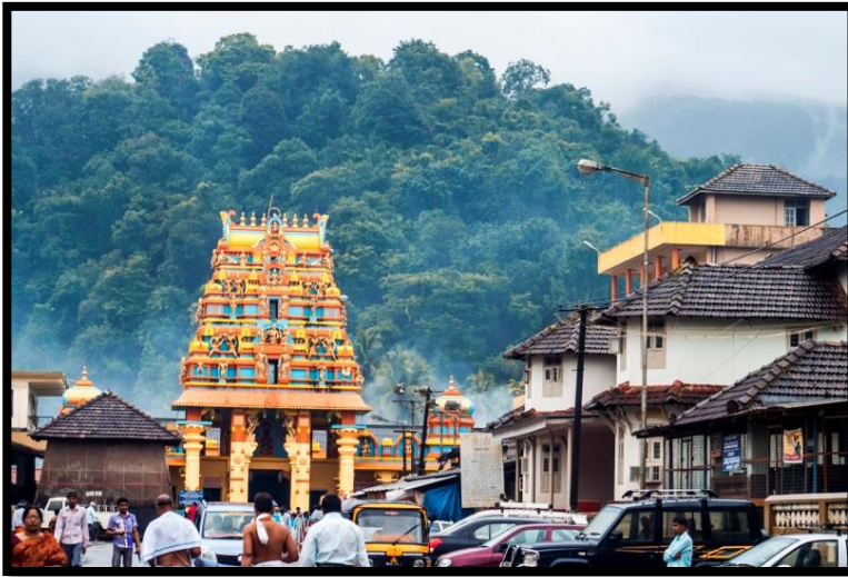
కుక్కె సుబ్రమణ్య క్షేత్రం

ధర్మస్థళలో వేకువనే లేచి కాలకృత్యాలు ముగించి, ధారాళంగా దొరికే నీళ్ళలో శుచిస్నానం చేసి వసతిగృహ నిర్వహకులకు గది తాళం అప్పగిస్తుంటే, అడ్వాన్స్ ఎమౌంట్ వంద నుంచి తిరిగి 50 రూ. వాపస్సు ఇచ్చారు. పదిమందికి సరిపడే గదికి ఏబై